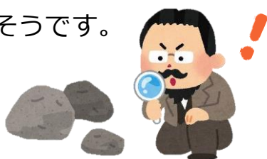
💡 ゼオライトの化学成分 (%)

加熱すると沸騰しているように見えることからギリシャ語で「沸騰 (ZEO) する石 (LITE)」と名付けられたそうです。